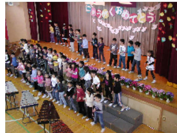
<入学式 2年生の歓迎の催し>