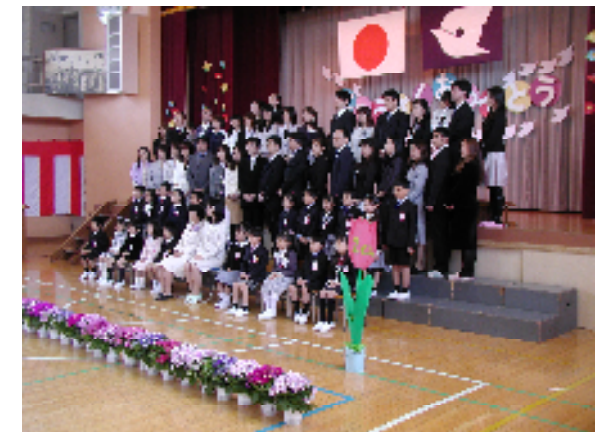
<入学式 1年生 集合写真>