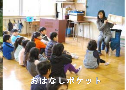
おはなしポケット