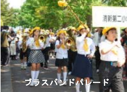
ブラスバンドパレード