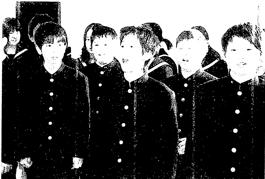
学年集会にて ~校歌の練習~