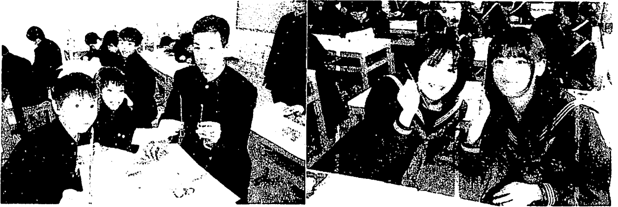
美術の授業で~鉛筆削り~