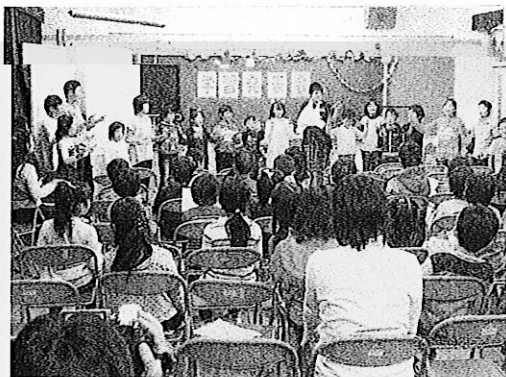
(手話コーラス「はじめの一步」)