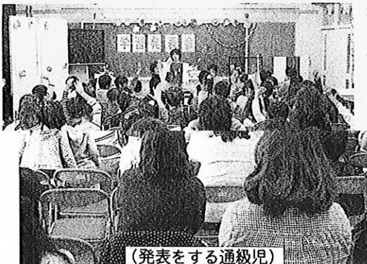
(発表をする通級児)

通級児童は、20名の堂々とした発表や手話コーラス。在籍学級の子どもたちは、普段の教室ではなかなか見ることのない友達一人一人の発表に大きな拍手を送っていました。こうした交流が共生の心を育んでくれることを願っています。