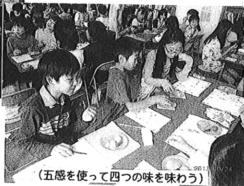
(五感を使って四つの味を味わう)

食べ物には4つの味がある。「しょっぱい」「すっぱい」「にがい」「あまい」の4つ。「フルーツグミ」を『鼻をつまんで』だとき『鼻をつままないで』食べたときには全く違うことを体験