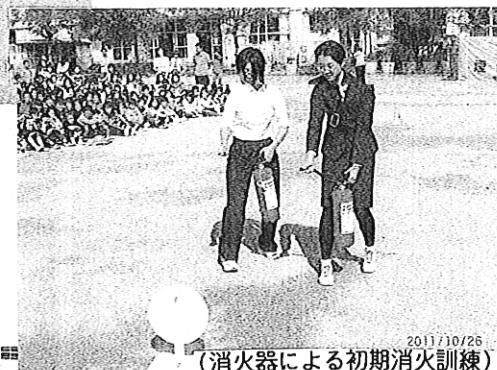
(消火器による初期消火訓練)

消火器を使っの初期消火についても先生方が実演しました。寒くなり火を使うことも多くなります。火事には注意を払いたいものです。