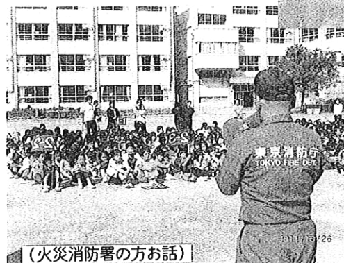
(火災消防署の方お話)

また、「火事」の中で多いのが「火遊び」によるものだそうです。子供たちが簡易ライターをいじっているうちに近くのものに火がついて火事になってしまったというケースも多いとのこと。簡易ライターにストッパーがついて子供では着火できにくくなっているものも最近では売り出されています。