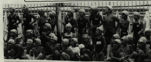
(応援する子供たち)