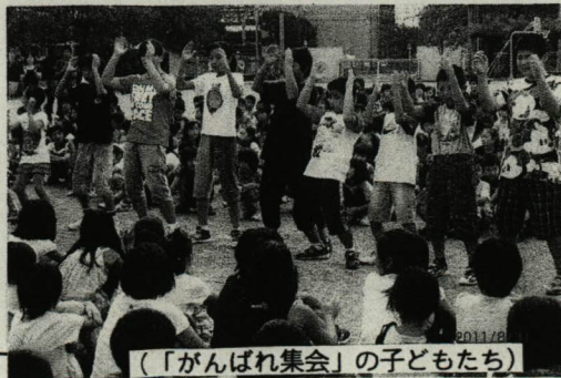
(「がんばれ集会」の子どもたち)

それに先立ち、31日の朝は、水泳大会での健闘を願っての「5年生がんばれ集会」が開かれました。