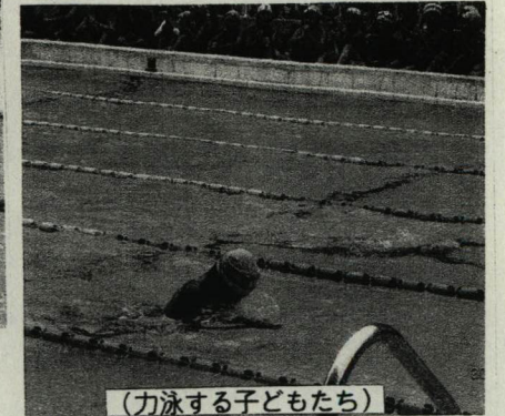
(力泳する子どもたち)