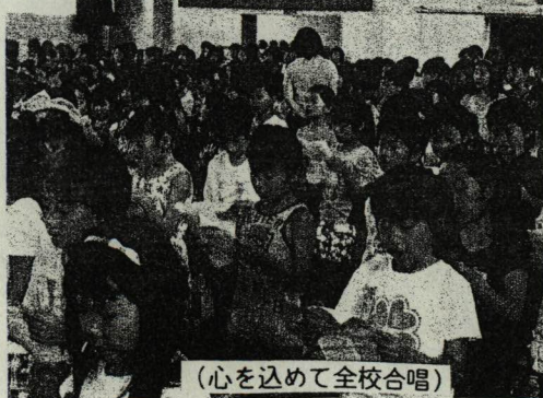
(心を込めて全校合唱)

七夕の7日の給食は、七夕にちなんで「天の川」を模した「そうめん」に「星(なると、オクラ)」が輝いているというものでした。