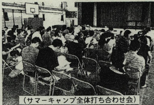
(サマーキャンプ全体打ち合わせ会)

6年生実行委員会も2回開かれ、6年生は、参加者というよりスタッフとして活躍してもらおうことになっています。