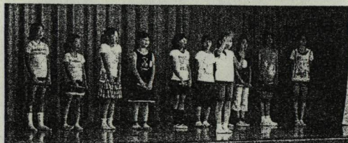
(音楽クラブの「トーンチャイム」)