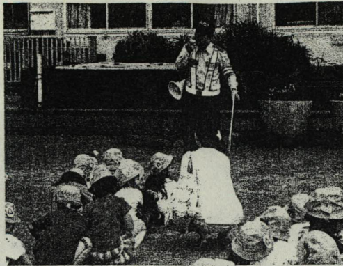
(おまわりさんの話を聞いて-1年)