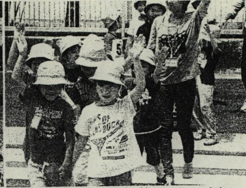
(横断歩道は手をあげて渡ります-1年)