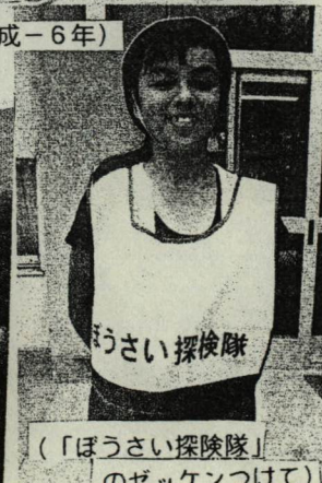
(「ぼうさい探検隊」のゼッケンつけて)