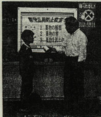
(薬物乱用防止教室-6年)