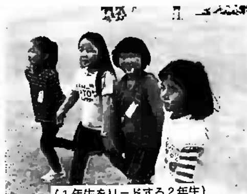
(1年生をリードする2年生)