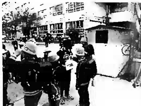
(募金中の代表委員)

代表委員のメンバーが交代で校門で募金を呼びかけました。学校の前マンションの方や通行中の方からも募金が寄せられました。子どもたちも大感激です。