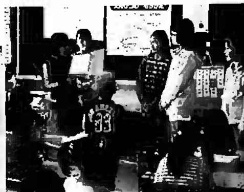
(1年生のお世話活動の6年生)