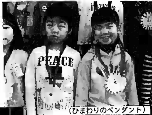
(ひまわりのペンダント)

1年生からは、「お兄さん、お姉さん、私たち1年生も『ろくっこ』の仲間入りをしました。とても嬉しいで